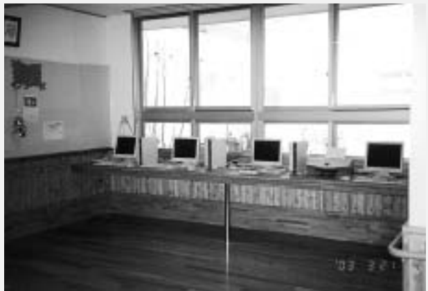
図書・パソコンコーナー

施設建設にあたっては、全国各地の施設見学と障害を持つ仲間とその家族による設計図面検討会を、ほぼ毎月、3年間繰り返しました。その意見を集約したものが現在の施設です。12m 3 を超える広い居室、幅2.5mの廊下、採光と通風を考え喫茶コーナーや図書コーナーなどをオープンにし、中央のトイレはストレッチャーでも対応できる広さに、そのトイレと浴室・食堂には床暖房を設備し、居室の扉は、自分の部屋が分かりやすく病院のような雰囲気にならないよう、パステル調の3色を交互に使い、居室の床は組み床にして怪我をしにくいようにし、感染